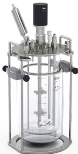
Zum Beispiel HABITAT ferment dw 5 für 5 Liter

Jetzt ergänzen Sie Ihr Kontrolleinheits-Paket mit den passenden Gefäßen: Zusätzlich zum Kontrolleinheits-Paket bestellen Sie entsprechend Ihrer Anwendung und Ihrem Arbeitsvolumen das passende Gefäß-Paket. Und schon kann es losgehen.