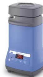
A 10 基本型 批次式研磨机 订货号 0004020700