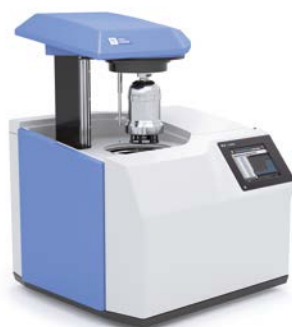
C 6000 氧弹量热仪 订货号 0008804300

如您需要, 在控温上使用 Oven 125 基本型和 控制型的同时还可有如下 IKA 仪器供您实 验室选择。