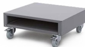
移动底箱 方便移动使用 订货号 0020007602