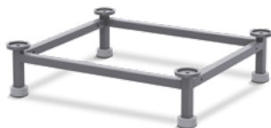
叠加架 叠加多个烘箱 订货号 0035001326