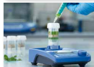
Пример. Гомогенизация листьев мяты с последующим отбором пробы